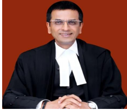
माननीय न्यायमूर्ती (डॉ.) धनंजय यशवंत चंद्रचूड भारताच्या सर्वोच्च न्यायालयाचे मुख्य न्यायाधीश आणि महाराष्ट्र राष्ट्रीय विधी विद्यापीठ मुंबई, चे कुलपती